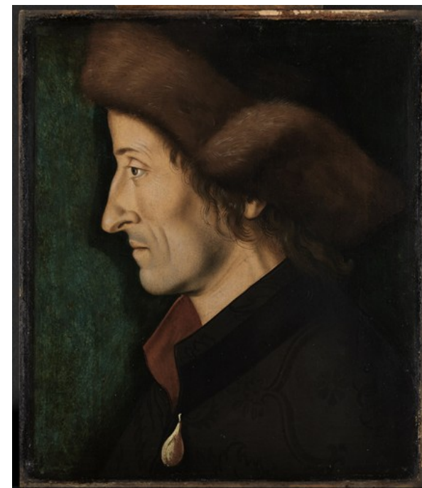
Sébastien Brant peint par un artiste anonyme (1494/1507), Karlsruhe, Staatliche Kunsthalle, n° 953