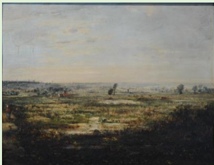
T. Rousseau, Paysage de marais, MBA Strasbourg (MNR 171)

L'exemple de la spoliation des bibliothèques, Catherine Maurer , Université de Strasbourg