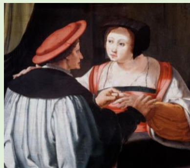
Lucas van Leyden, Les fiancés, MBA Strasbourg (MNR 445)

Aspects de droit international privé : table-ronde animée par Delphine Porcheron , Université de Strasbourg,