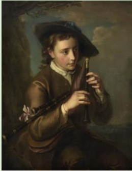
Ph. Mercier, Joueur de musette, MBA Strasbourg (MNR 67)

Une analyse des 27 MNR déposés à Strasbourg, Dominique Jacquot , Musée des Beaux-Arts de Strasbourg et Thibault de Ravel d'Esclapon , Université de Strasbourg