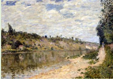
Sisley, Les coteaux de la Celle. Vue de Saint-Mammès, MAMCS Strasbourg (MNR 210)

Au-delà des œuvres MNR : La restitution des biens culturels spoliés entre 1933 et 1945, sous la présidence d' Emmanuelle Polack , Musée du Louvre.