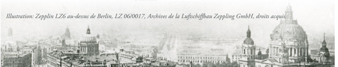
Illustration: Zeppelin LZ6 au-dessus de Berlin, LZ 06/0017, Archives de la Luftschiffbau Zeppelin GmbH, droits acquis.