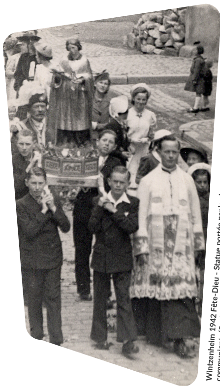
Wintzenheim 1942 Fête-Dieu - Statue portée par les jeunes communiants

Modération : Hervé de Chalendar, journaliste à Saisons d'Alsace , magazine édité par les DNA et L'Alsace .