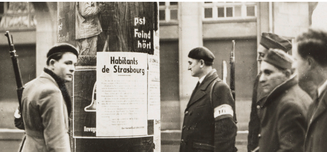
FFI lisant un appel du général Leclerc à Strasbourg en novembre 1944

Salle « Wihr » à Horbourg-Wihr (rue de Fortschwihr)