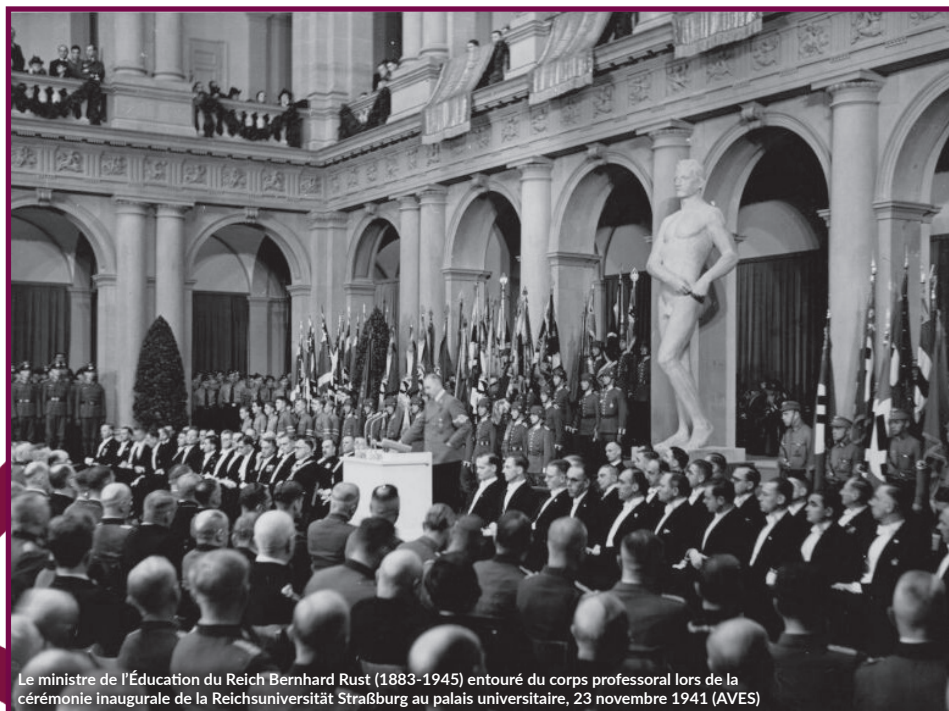
Le ministre de l'Éducation du Reich Bernhard Rust (1883-1945) entouré du corps professoral lors de la cérémonie inaugurale de la Reichsuniversität Straßburg au palais universitaire, 23 novembre 1941